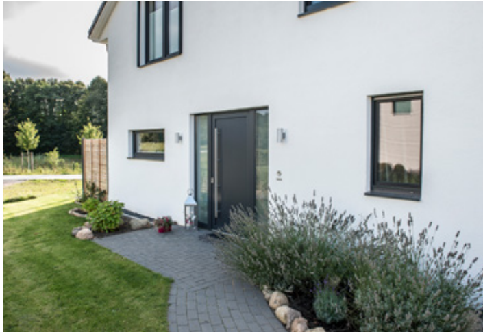
Die Kleins bewohnen ein großes, sonnendurchflutetes Haus mit vielen Fenstern und großem Garten.