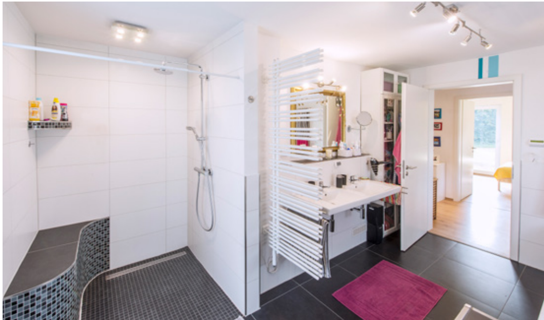
Die großzügige Raumaufteilung ermöglicht ein weiträumiges Bad und einen gut nutzbaren Flur.